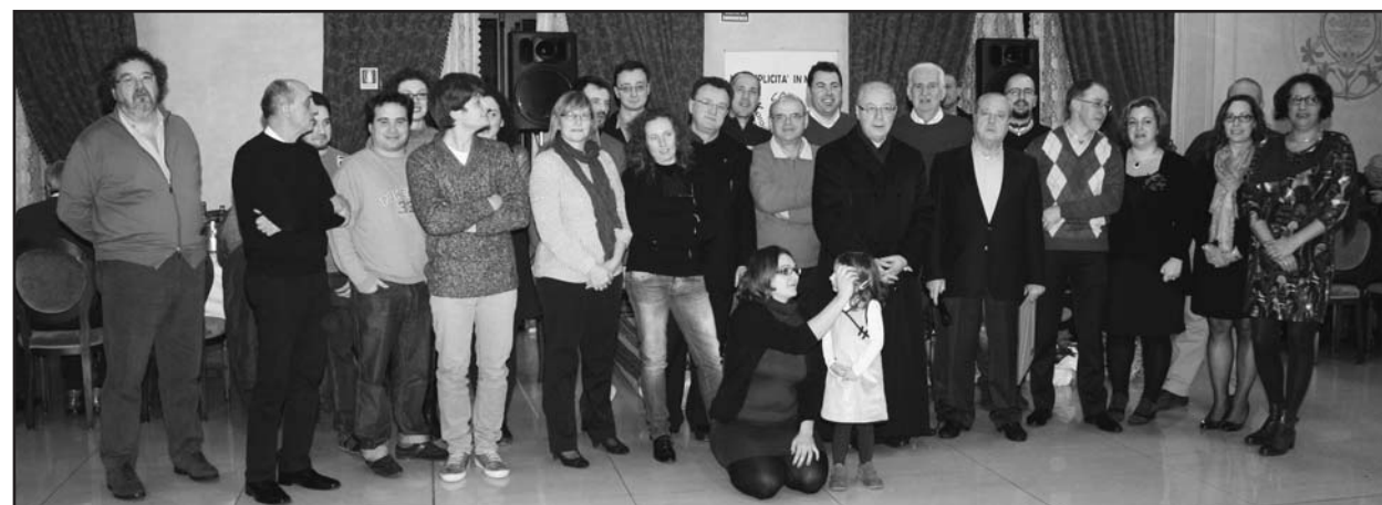
Alcuni dei volontari presenti alla serata del Premio S. Pancrazio.