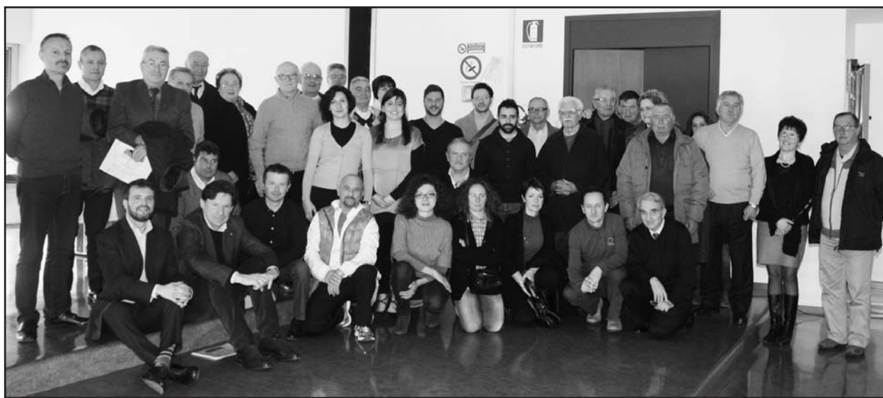
I partecipanti all'assemblea Avis.