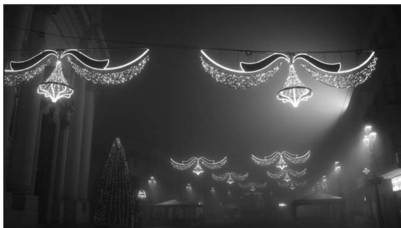
Una serata di nebbia in Piazza S. Maria.

A dire il vero solo le luminarie hanno dato il segnale delle festività unite alla giostra dei bambini, proposta dall'AR.CO. E' stato sicuramente un Natale all'insegna del risparmio, nessuna presenza commerciale o musicale in piazza, solamente i presepi nelle scuole e la ormai consueta esposizione presso la sala