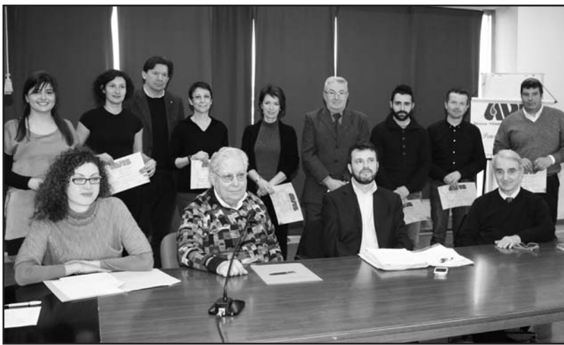
Il tavolo della dirigenza con alcuni dei premiati.