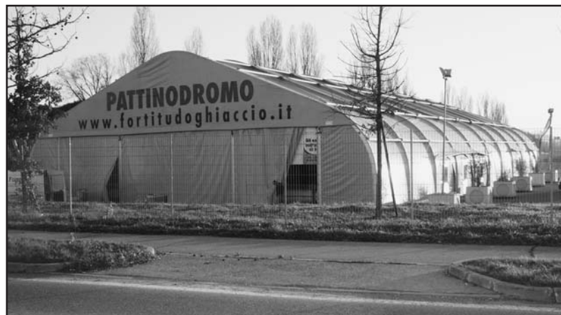
La struttura che dovrebbe passare dal Centro Fiera nell'area a fianco del Palageorge.