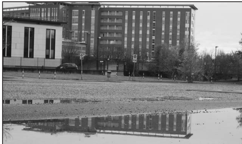
L'ospedale che si rispecchia nell'acqua del parcheggio.